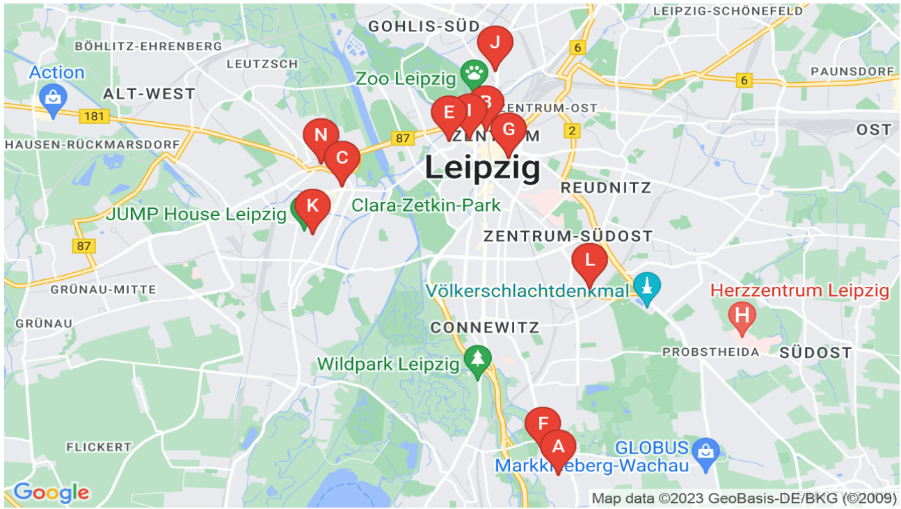
Afstand en tijden werden berekend voor de snelste autoroute. Bedankt Google!